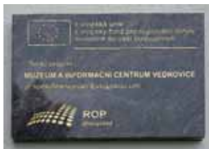
Muzeum a informační centrum Vedrovice