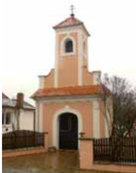
Kaple sv. Jana Nepomuckého