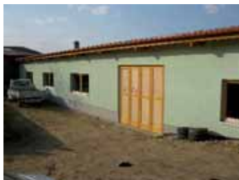
Truhlářská dílna Jiřího Hrdiny

Finanční alokace na opatření IV.1.2. Realizace místní rozvojové strategie na rok 2010 byla vyčerpána a to ve 4. a 5. výzvě 2010 v celkové výši 7.298.645,- Kč.