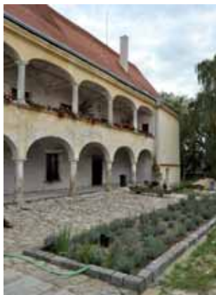
Galerie 1602 ve Slatině

Finanční alokace na opatření IV.1.2. Realizace místní rozvojové strategie na rok 2010 byla vyčerpána a to ve 4. a 5. výzvě 2010 v celkové výši 7.298.645,- Kč.