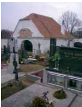
Márnice v Hostím