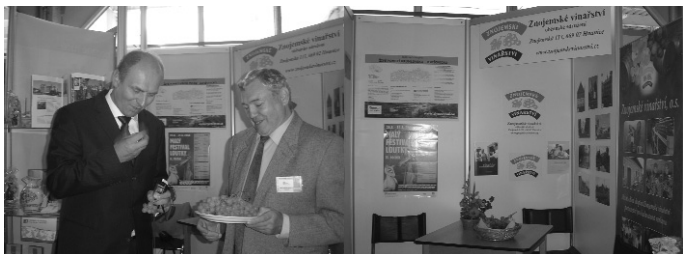
Země živitelka 2008, České Budějovice, 21. - 26. srpen 2008

V srpnu 2008 jsme prezentovali naše občanské sdružení na 35. ročníku mezinárodní výstavy Země živitelka.