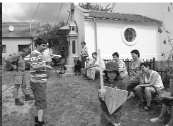
Zahájení botanického odpoledne v Jamolicích.

V dubnu 2007 a 2008 jsme se zúčastnily se stánkem Ekoporadny Dne země na náměstí v Moravském Krumlově ve spolupráci s Domem dětí a mládeže.