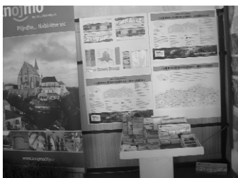
Znojensko - Zahrada Moravy, 11. - 13. září 2008

Poprvé jsme se účastnili výstavy Znojensko – zahrada Moravy, která se konala v září 2008 při příležitosti Znojenského vinobraní v Louckém klášteře ve Znojmě.