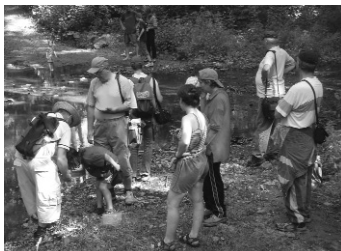
Údolí Plenkovického potoka.